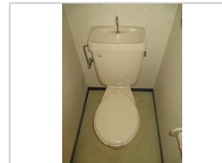
温水洗浄暖房便座に取り替えます