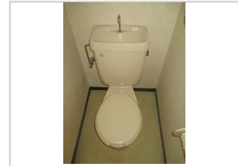
温水洗浄暖房便座に取り替えます