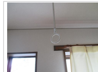
室内用物干し金具付き