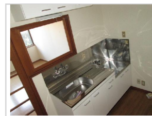
カランはシングルレバーに取替えます。