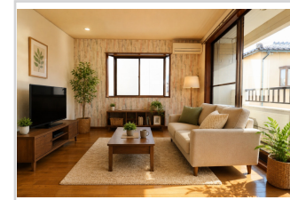
この画像は生成AIによるCG加工にて家具を配置しています